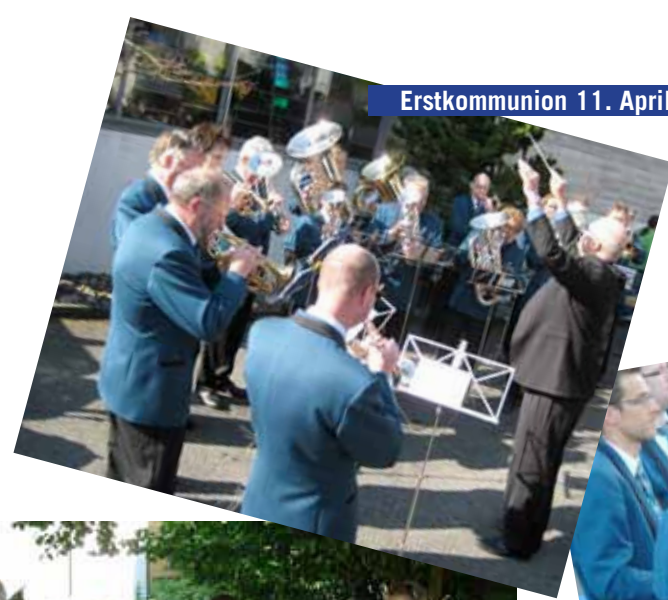
Erstkommunion 11. April