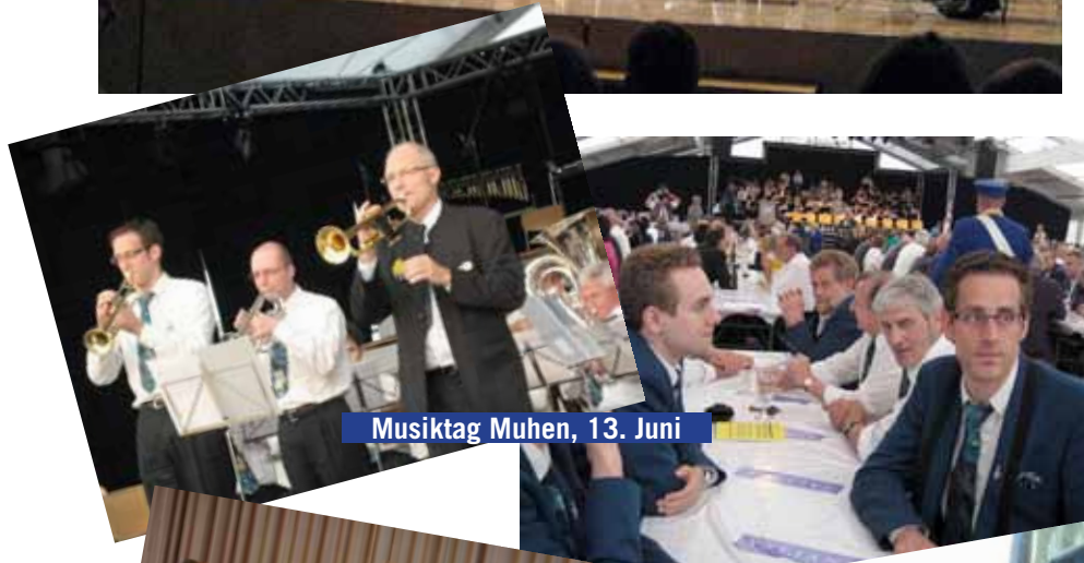
Musiktag Muhen, 13. Juni