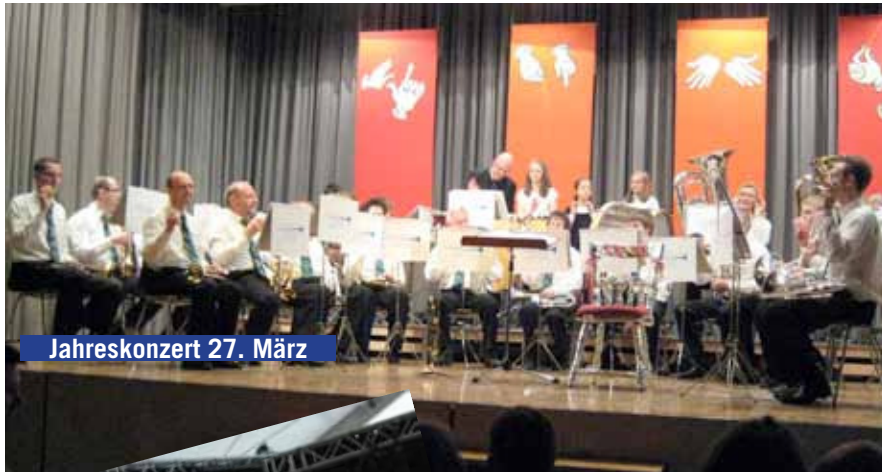
Jahreskonzert 27. März