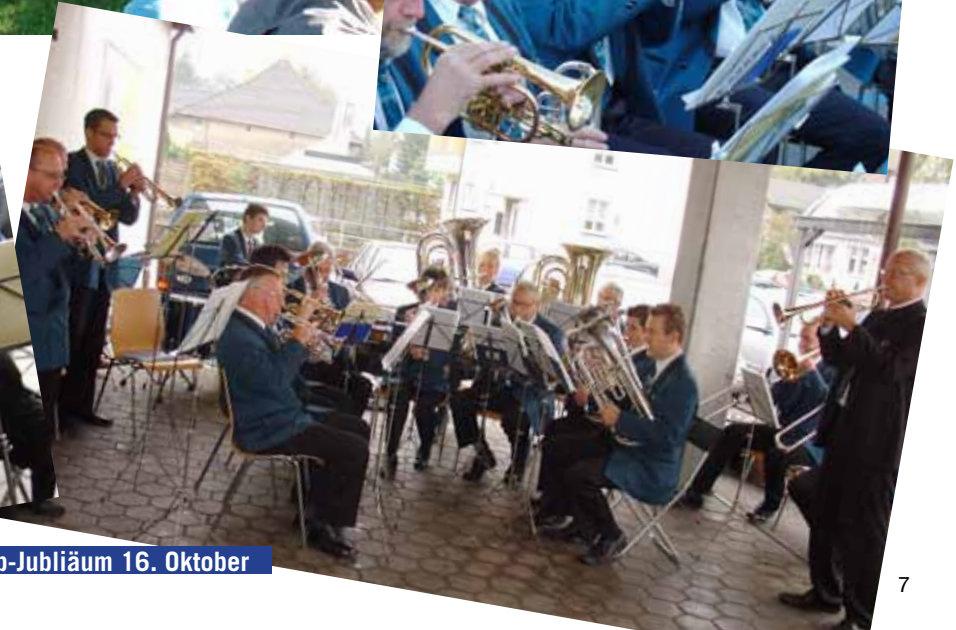
Coop-Jubliäum 16. Oktober