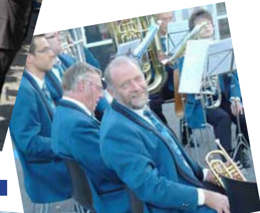
Beizlifescht 3. September