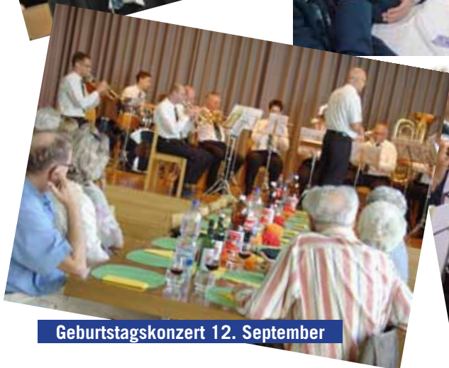
Geburtstagskonzert 12. September