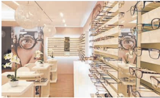
Im Sehzentrum Suhr werden Sie bestens beraten