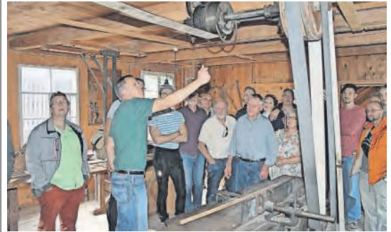
Die Musikgesellschaft Kölliken im Schiefertafelmuseum Elm GL